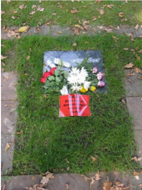
Trauerhandlungen an sogenannten „Ersatzgrabstellen“