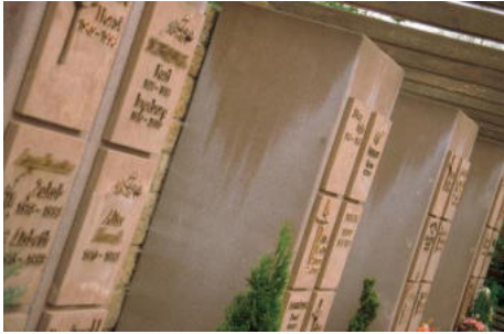
Urnenwand (sogenanntes „Kolumbarium“)