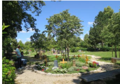
Zwei Beispiele von funktionieren, akzeptierten und erfolgreich umgesetzten Ideen auf dem Friedhof in Süßen

Friedhöfe sind dabei in Zukunft so zu gestalten, dass sie in ihren differenzierten Beisetzungsangeboten einen aktiven Umgang mit dem einzelnen Beisetzungsort ermöglichen, ohne zu (pflegenden) Handlungen zu verpflichten. Nur so kann der Friedhof für eine pluralistische Gesellschaft mit sich stetig wandelnden Normen und Werten als Ort der Beisetzung nützlich und für die lebenden Hinterbliebenen attraktiv und in ihrer Trauerarbeit hilfreich bleiben. Deshalb gilt es, zukünftig für Menschen „lohnende“ Friedhöfe nicht durch immer neue Attraktivitätspakete, sondern durch Beisetzungsorte zu definieren, die den Trauerprozess erwiesenermaßen unterstützen. Zudem besteht die einmalige Chance, den öffentlichen Friedhof als unersetzlichen „Raum für Trauer“ neu zu entwickeln und wieder in der Gesellschaft zu etablieren. Die bestehenden Friedhöfe bekommen – über ihre Funktion als Bestattungsort hinaus – eine neue und zentrale Bedeutung innerhalb der Kommunen und der Gesellschaft. Sie werden (wieder) zu einem sozialen Ort. Der Friedhof entwickelt sich vom reinen Bestattungsort hin zum „lebendigen Ort der Trauer“ und hat grundsätzlich und langfristig gute Überlebenschancen. Die Realisierung dieser Friedhöfe der Zukunft ist allerdings abhängig von der Weitsicht, Innovationsbereitschaft und der Sensibilität der Verantwortlichen gegenüber vielfältigen gesellschaftlichen Veränderungen.