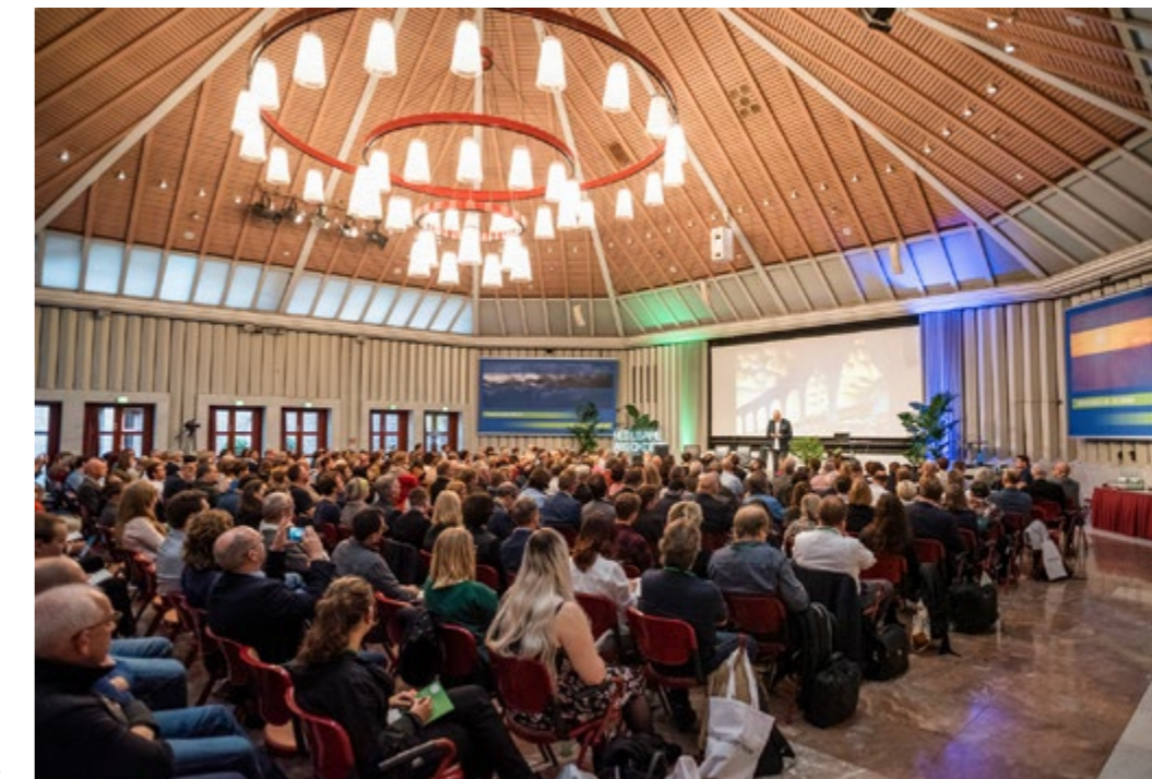
Kongress Heilsame Abschiede in Köln

und kundenorientierte Entwicklung bestehender Friedhöfe. Der Pionier der Zukunftsforschung ist der Meinung, dass „angesichts des gesellschaftlichen Wandels individuelle Vorstellungen und Empfindungen der Trauernden weit stärker in den Mittelpunkt rücken müssen, als dies der Friedhof von heute zulässt.“ Für Horx und die Soziologen stehen zurzeit die persönlichen Wünsche von Hinterbliebenen und die Anforderungen an eine hilfreiche Trauer in Diskrepanz zur juristischen Wirklichkeit der tradierten Bestattungskultur. Starke Reglementierung erzeugt Konformitätsdruck und verhindert heilsame Trauerhandlungen. Friedhöfe sind, meist in