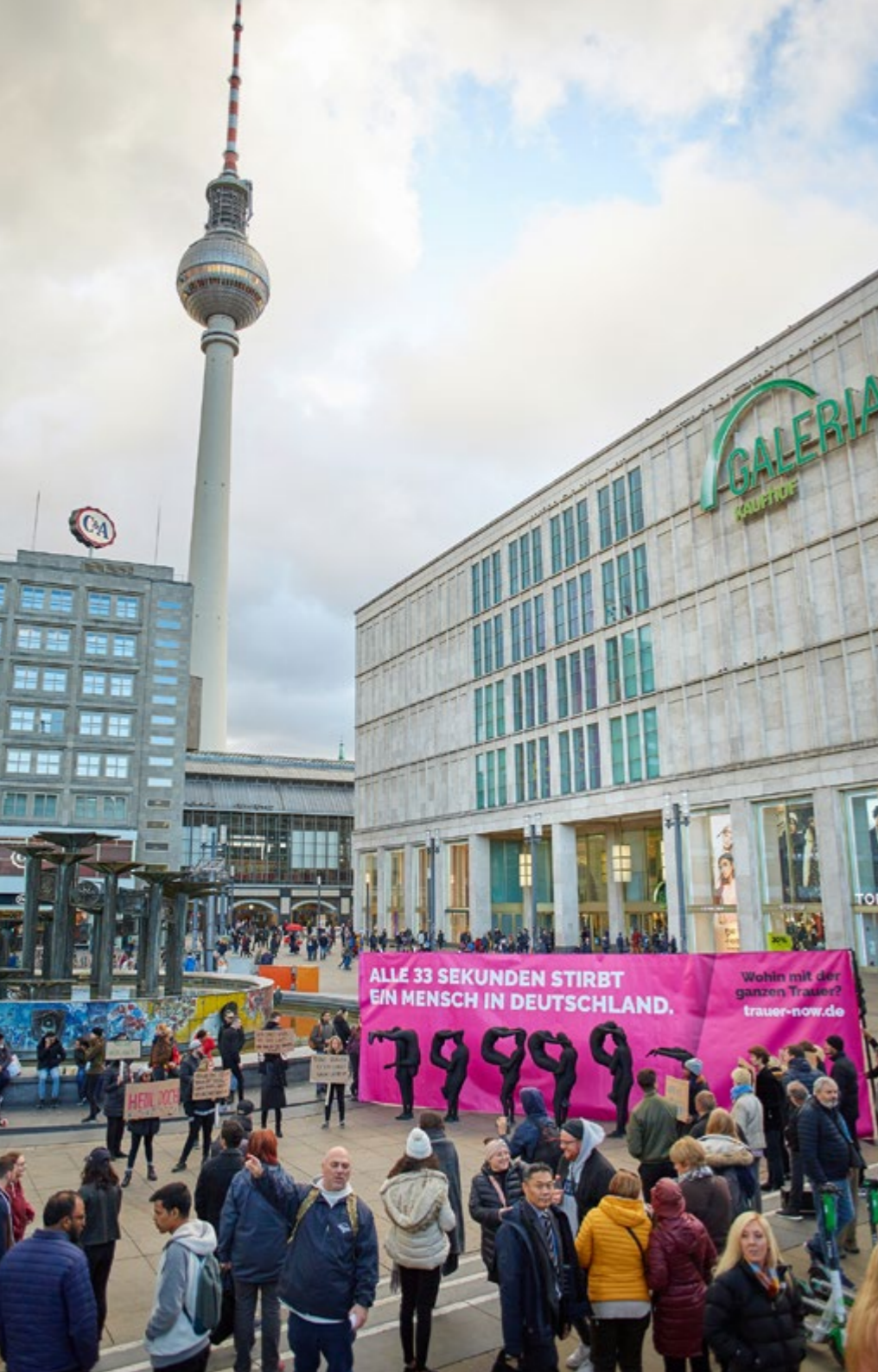
Im Rahmen des Projektes Raum für Trauer: PR-Aktion für das Online-Magazin trauer-now.de – Menschliche Sterbeuhr auf dem Berliner Alexanderplatz