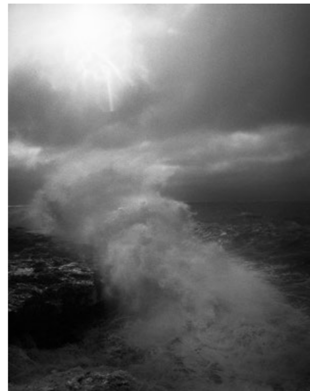
Vier Fotos von Daniel Tchetchik, Dark Waters.

und auf die gegen die Felsen schwappenden Wellen einstellt, beim Blick auf die wie leer gefegten Strände, die wie verlassen daliegenden Küsten-Orte, beim Blick auf die Zäune, Mauern und Bunker am Strand, mit denen sich Europa zu einer Festung ausbaut, die kalt und leer und herzlos wirkt.