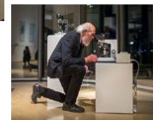
Impressionen von der Ausstellungseröffnung