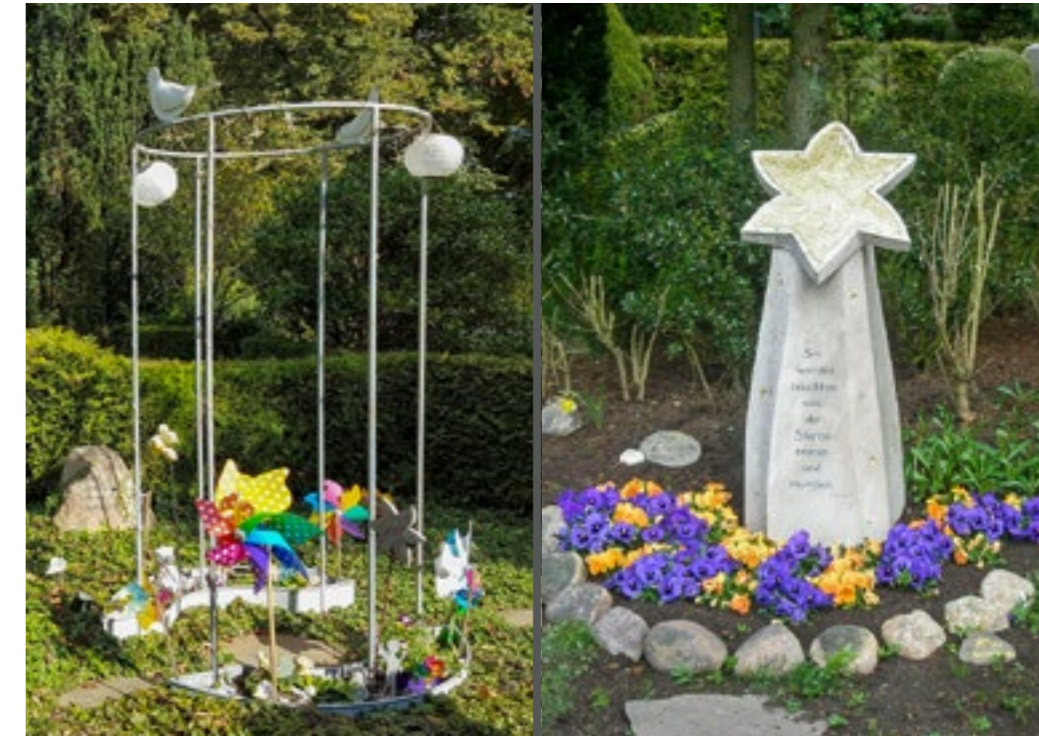
Abb. 1 Preetz, Alter Friedhof