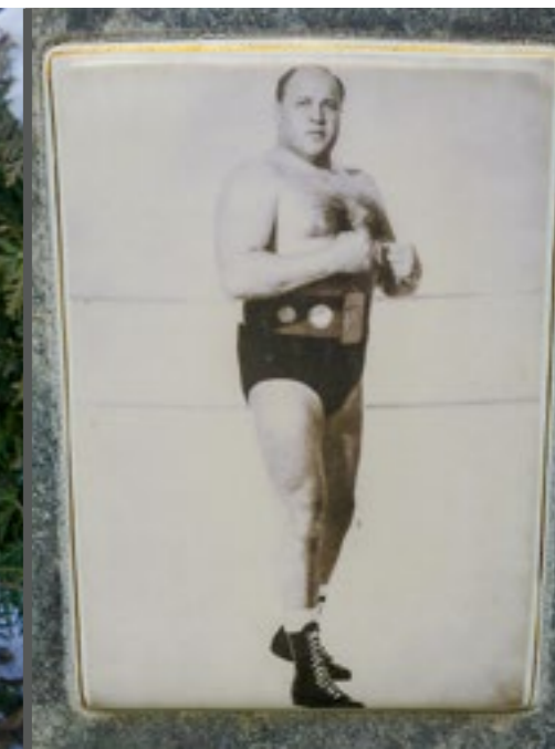
Zum Beitrag von Thorsten Benkel zur postmortalen Konstruktion von Geschlechterverhältnissen.