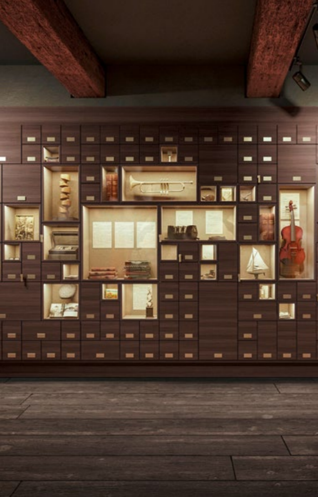
Kolumbarium Die Eiche, Lübeck: Grabkammern, teilweise mit individuell gestalteten Vorkammern (Simulation)