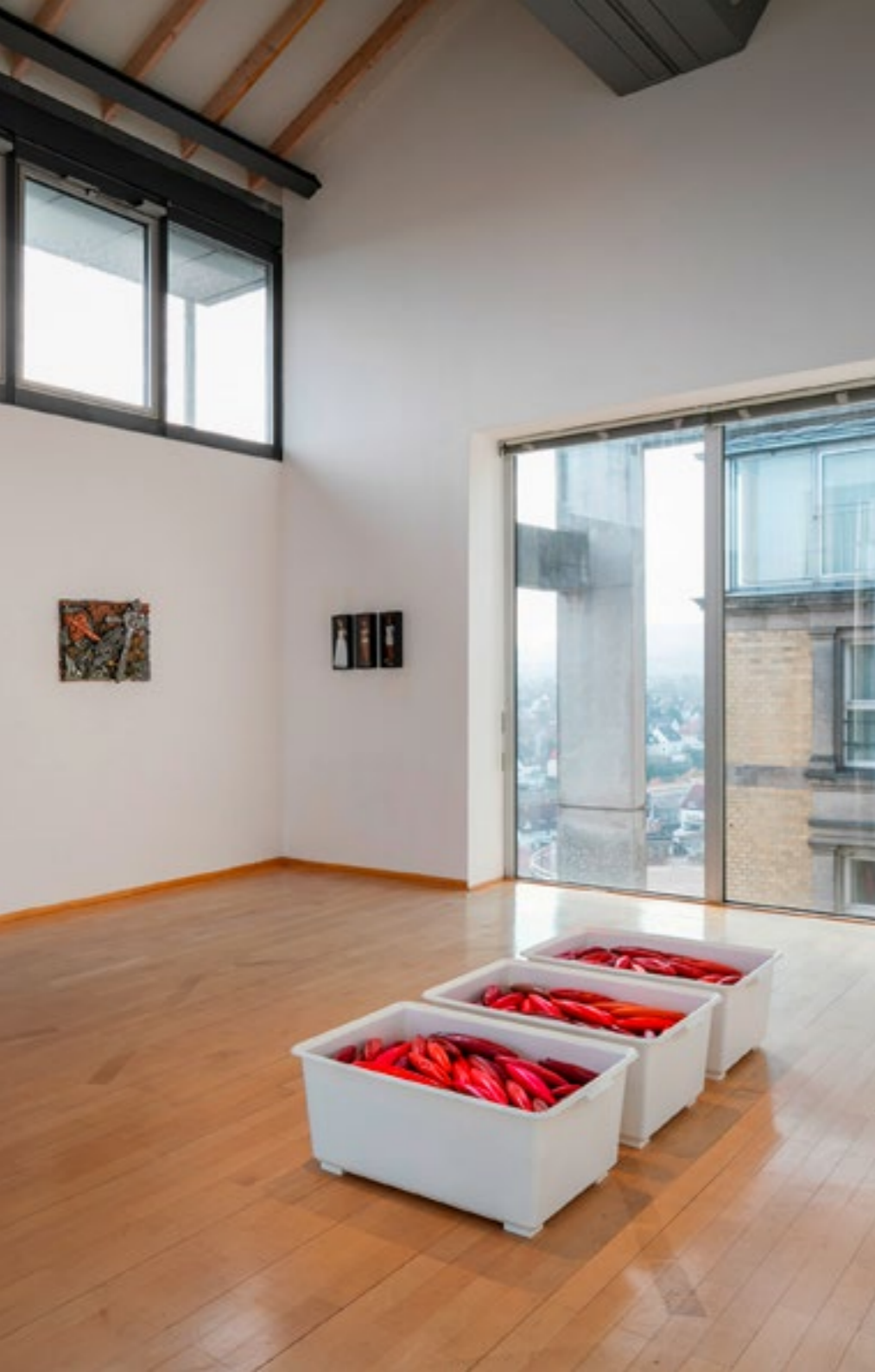
Blick in die Ausstellung DAS LETZTE von Susan Donath und Juliane Uhl. Im Vordergrund die Installation „Überfluss der pinkfarbenen Einäuger“, 2004–2010, von Susan Donath.

Von Windheim sammelte quer durch die Kunstgeschichte Abbildungen eines legendären Sujets: Das Antlitz Christi im Schweißbuch der heiligen Veronika. (Ausstellung MEMENTO)