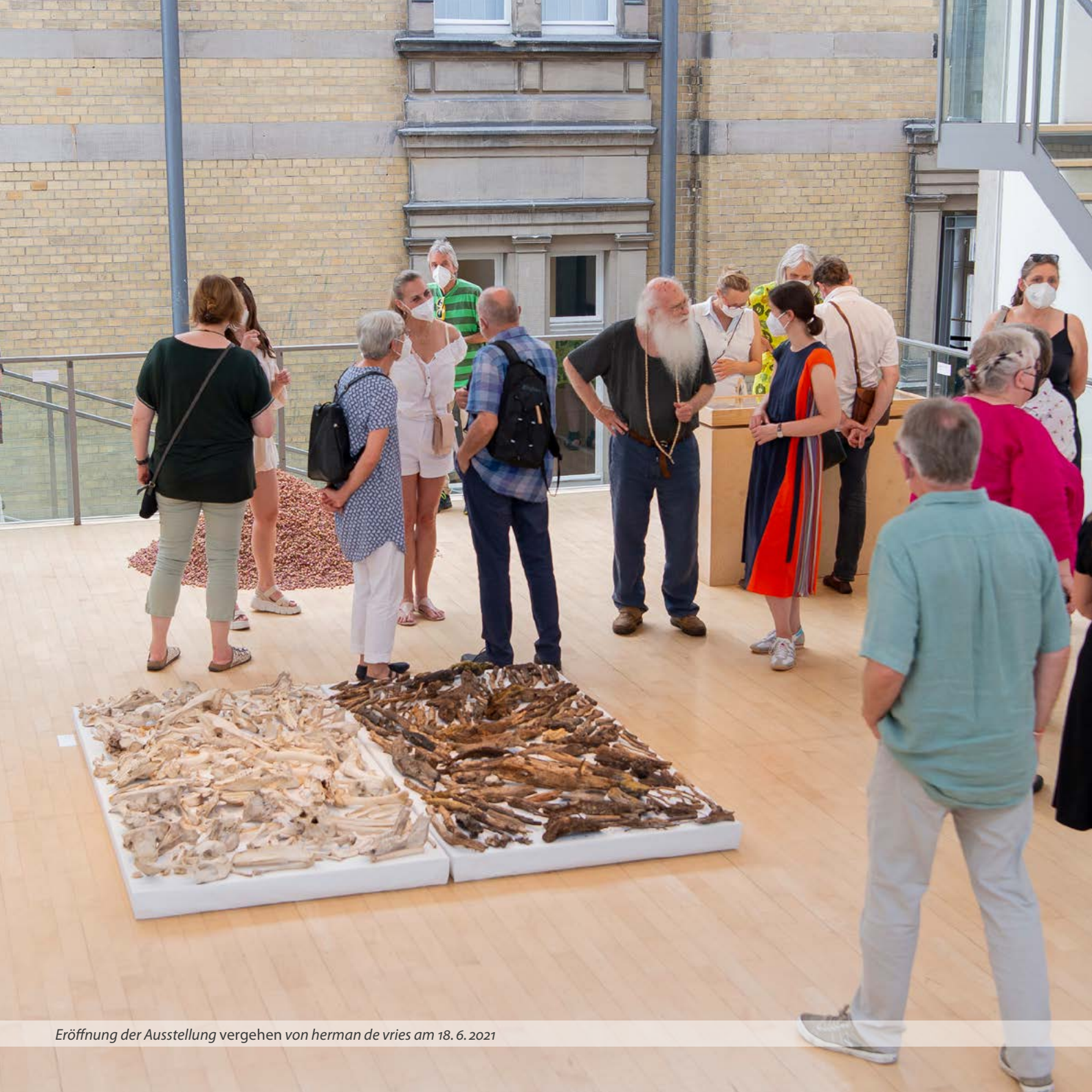
Eröffnung der Ausstellung vergehen von herman de vries am 18. 6. 2021